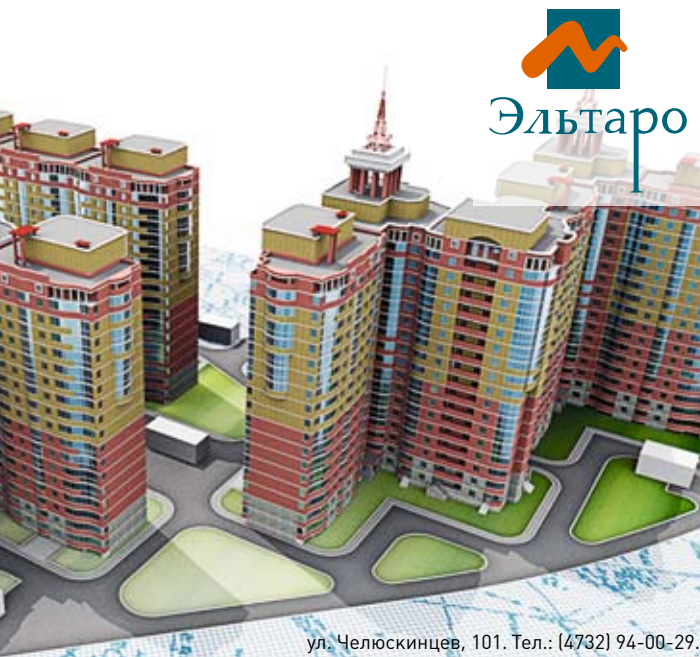
ул. Челюскинцев, 101. Тел.: (4732) 94-00-29.

В предыдущих выпусках проекта «Стройка» компания «Эльтаро» была ошибочно названа застройщиком жилого комплекса на ул. Челюскинцев, 101. На самом деле застройщиком является ООО «Воронежстрой»; «Эльтаро» по данному адресу ведет эксклюзивную реализацию.